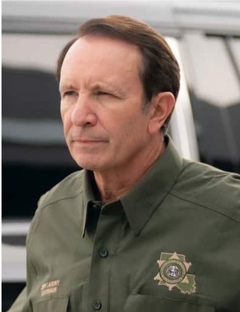
Jeff Landry en septembre 2025.